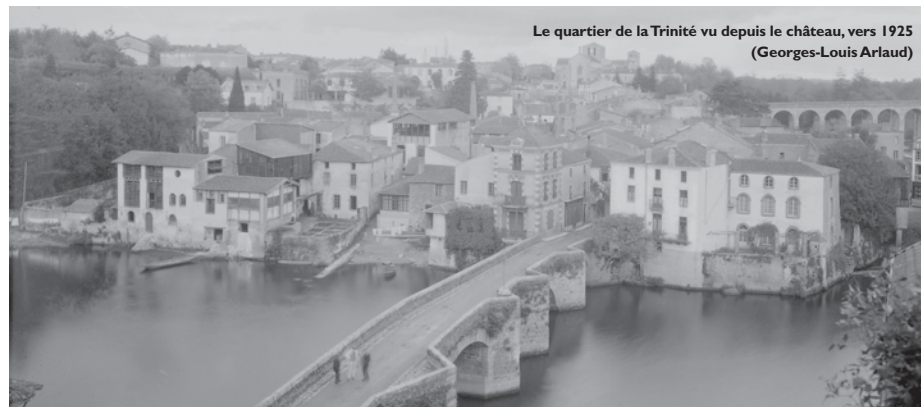
Le quartier de la Trinité vu depuis le château, vers 1925 (Georges-Louis Arlaud)