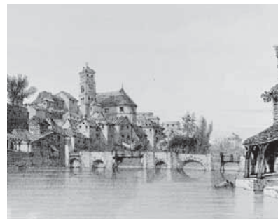
Le pont de la ville au début du XIX e siècle, en partie en bois. L'église Notre-Dame n'a pas encore été remaniée. (Lithographie par Daniaud d'après un dessin de Drake)

À l'origine, le Pont de la Vallée ou Pont de la Ville rattache le bourg castral* de la rive gauche aux faubourgs situés sur la rive droite, la Trinité et Saint-Antoine. Les deux noms du pont y font référence : on l'empruntait soit pour rentrer dans la ville, soit pour en sortir. Il relie le bourg