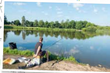
Port des Grenouilles