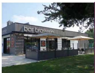
BAR LA SANGUÈZE

Brasserie avec formule rapide le midi et une carte en soirée. Produits frais et de saison. Sur place et à emporter.