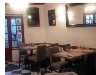
AU PIED DE L'ESCALIER

Gastronomie variée et innovante où tout est fait maison. Belle surprise avec des épices utilisées aussi bien dans les entrées, les plats et même les desserts.