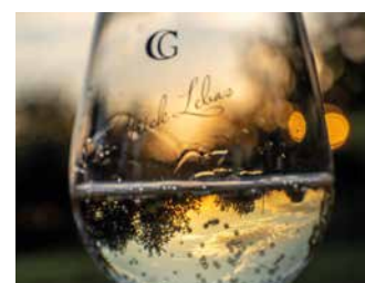
DOMAINE DU GRAND