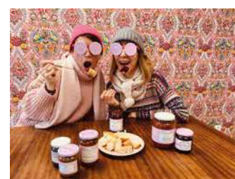
MUROISE ET COMPAGNIE

Artisanes Confiturières Aventurières, notre équipe 100 % féminine vous concocte de succulentes confitures traditionnelles.