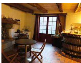
DOMAINE DES 3 VERSANTS

Domaine viticole familial qui a su garder l'âme de ses origines avec ses bâtiments traditionnels et ses cuves verrières souterraines.