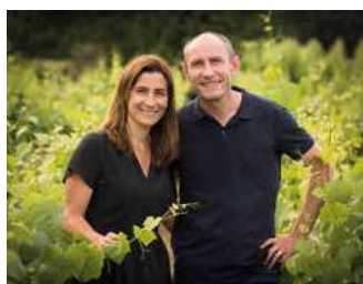
CHÂTEAU DE LA RAGOTIÈRE

Dans un domaine familial majestueux, visite et dégustation des vins blancs élégants et de cépages insolites. En conversion bio. Ateliers œnologiques. Animations au domaine.