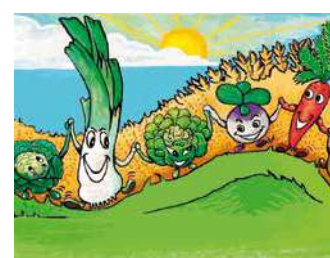
GAEC VALLÉE DE L'OGNON

Production de légumes, plantes aromatiques, fruits. Vente de produits fermiers et épicerie fine.