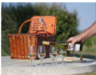
NANTES WINE TOUR - NWT

Prestations œnotourisme et événements autour du Vin : animations œnoludiques, olympiades du Vigneron, quiz Vins et Gastronomie, casino des saveurs, du vin... et organisation d'événements.