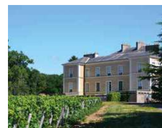
CHÂTEAU DU CLÉRAY