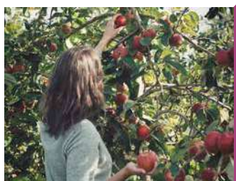
LES CÔTEAUX NANTAIS

Arboriculteur et transformateur de fruits bio depuis 1970. Venez découvrir nos fruits, légumes et produits d'épicerie au Marché des Côteaux. Vente au magasin et animations.