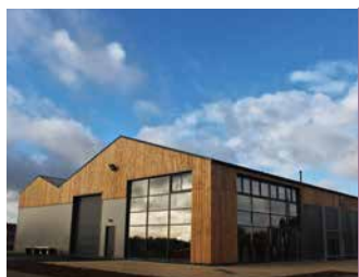
DOMAINE JÉRÉMIE HUCHET

Espace moderne et chaleureux pour des moments conviviaux autour des plus jolis terroirs du Muscadet. Animations au domaine.