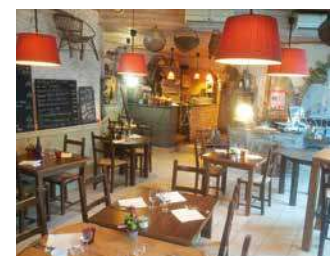
A LA PETITE RUELLE

Cuisine traditionnelle de marché à l'ardoise, originale et quelque peu décalée. La carte change régulièrement. Plats à emporter.