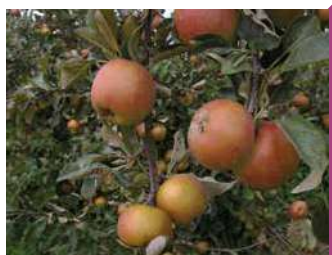
DOMAINE HENRI POIRON