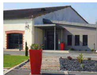
DOMAINE RAPHAEL LUNEAU