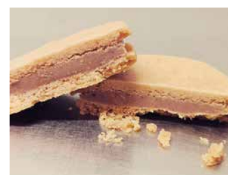
LABORATOIRE A BISCUITS

Le LaBoratoire à Biscuits est une jeune entreprise artisanale spécialisée dans la fabrication de biscuits fourrés (praliné amandes et noisettes, gianduja, figues, cannelle de ceylan, thé earl grey, cacao...). Une véritable expérience gourmande qui fera succomber les amateurs de produits gastronomiques de qualité.