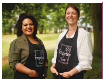
EMPLETTES ET PIPELETTES

Épicerie Boutique de produits locaux, vrac, créations locales (bijoux, savons...). L'été, terrasse pour une boisson et des douceurs à grignoter.