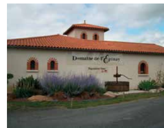
DOMAINE DE L'ÉPINAY

Des traditionnels Muscadet aux vins d'exception, toute une sélection de vins de pays pour accompagner vos événements festifs.