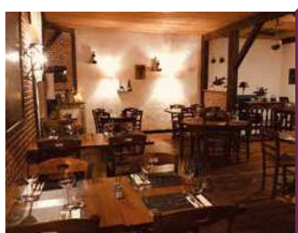
LA PETITE AUBERGE

Un lieu unique au parfum d'autrefois. Produits de saison, recettes traditionnelles avec les « petites côtes », la spécialité du restaurant. Plats à emporter.