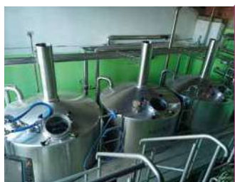
BRASSERIE DE LA DIVATTE

Production et ventes directes de bières artisanales ; les Trompes Souris, produites en partie de houblon cultivé sur place. Visite commentée sur réservation.