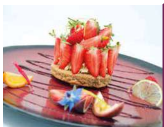
AUBERGE DU VAL DE LOIRE

Spécialités des bords de Loire dans un cadre chaleureux : anguilles, grenouilles, beurre blanc... parmi d'autres plats de saison. Plats à emporter