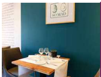
AUBERGE DE LA MADELEINE

Restaurant qui fait la part belle à son terroir, le chef sélectionne avec rigueur des producteurs et artisans engagés en circuit-court. Plats à emporter.