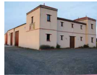
CHÂTEAU LE VALLON