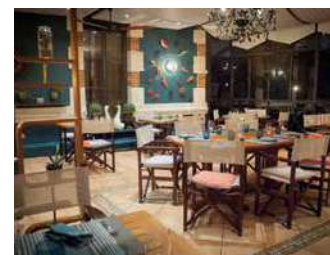
RESTAURANT DE LA VALLÉE

En bordure de la Sèvre avec vue sur le château et l'église, 3 ambiances différentes : les arcades, la tour et la verrière. Cuisine à base de produits locaux et saveurs de voyages.