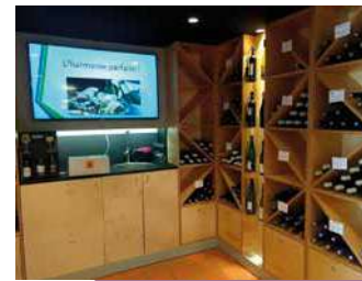
LA CAVE DES MUSCADET

Au sein de l'Office de Tourisme, l'association de la cave des Muscadet de la Vallée de Clisson regroupe 24 vigneron de la Vallée de Clisson.