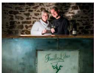
DOMAINE FAMILLE LEBAS

La vigne est une histoire de famille et de passion. Viticulteur de père en fils depuis plusieurs générations. Accueil groupe.