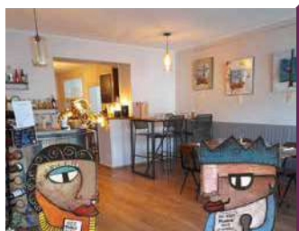
UNE TABLE AVEC PLAISIR

Dans son restaurant, Mickaël met en scène les produits locaux au fil des saisons et Céline vous accueille comme à la maison. Plats à emporter.