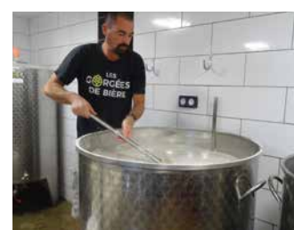
LES GORGÉES DE BIÈRE

Bières artisanales fabriquées dans le terroir du Vignoble Nantais avec du malt et du houblon bio.