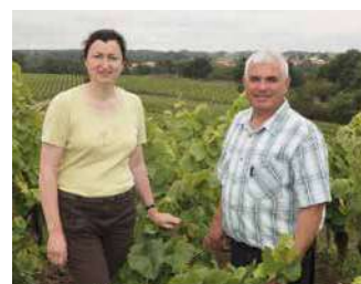
DOMAINE LE FIEF DUBOIS

Vignoble situé sur des terroirs bien exposés et réputés. Dégustation dans une cave traditionnelle au cadre chaleureux.