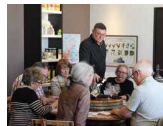
DOMAINE DE LA GRANGE

Vignerons depuis trois générations, visite et dégustation à la cave. Scénographie des 5 sens. Aire de pique nique. Accueil camping car. Animations au domaine.