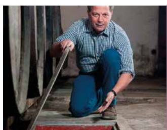
DOMAINE HENRI POIRON