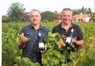
DOMAINE MARTIN LUNEAU

Le Domaine Martin-Luneau est une exploitation viticole familiale depuis 4 générations. Visite des caves et dégustation. Animations au domaine.