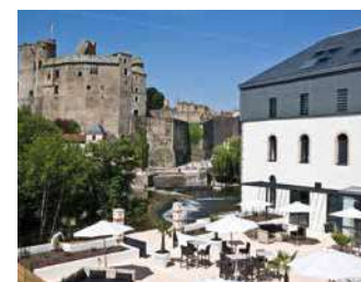
BEST WESTERN PLUS