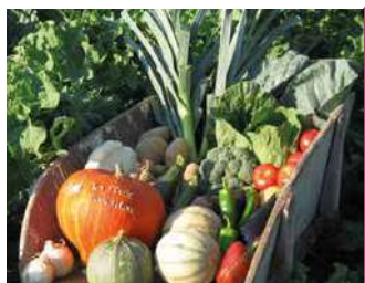
LA FERME DU VAL FLEURI

Magasin de produits du terroir avec les spécialités régionales, des produits frais. Présence d'animaux de la ferme pour les enfants.