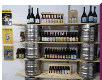
BRASSERIE DE LA DIVATTE

Dégustation de la production de la brasserie artisanale dans une ambiance conviviale. Soirées concerts Bière & Musique une fois par mois et autres événements festifs à découvrir sur la page facebook.