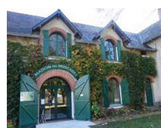
MAISON DU MUSCADET

44 190 Gétigné 49630 Corné / 49124 Saint-Barthélemy-d'Anjou / 49330 Châteauneuf-sur-Sarthe / 49220 Vern d'Anjou / 49160 Saint-Philbert-du-Peuple / 49440 Challain-La-Potherie