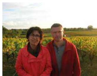
DOMAINE JEAN LUC VIAUD

Une large gamme de vins, de produits du terroir et un nouveau cépage « le melon noir ». Animations au domaine.