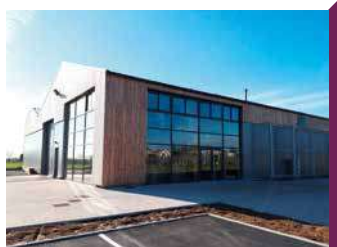
GINGUETTE LA HUCHETTE

Guinguette atypique : une pergola au milieu des vignes. Dégustation des vins du Domaine, bières et menu de saison dans un esprit champêtre et festif.