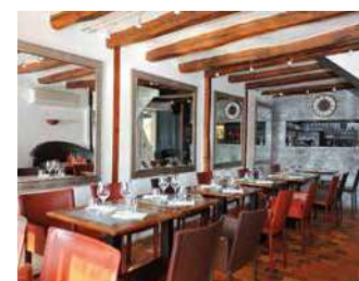
AUBERGE DU CHÂTEAU

Accueil chaleureux et cuisine savoureuse. Salle climatisée, verrière surplombant la Sèvre nantaise pour vous accueillir toute l'année. Plats à emporter.