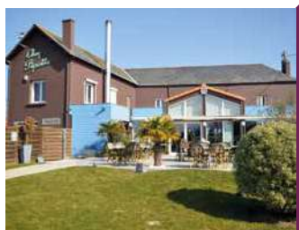
AUBERGE CHEZ PIPETTE

Dans cette institution, l'équipe s'efforce de perpétuer la tradition de l'Auberge. Spécialités de grillades sur sarment de vignes. Terrasse ensoleillée l'été.