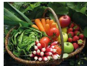
FERME DE LA CHEBUETTE