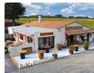
AUBERGE DE LA COMTIÈRE

Cadre chaleureux, convivial et de qualité. Grande cheminée centrale, permettant une cuisson des viandes au cep de vignes.