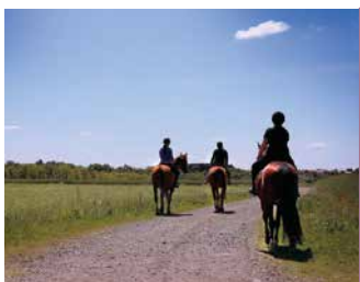
VIGNES EN SELLE

Capacité : 40 trottinettes disponibles · Tarif : enfants de 12 à 16 ans de 29 à 49€ | Adultes de 39 à 59€.