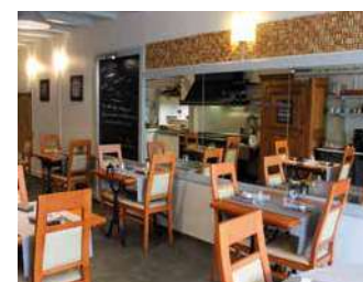
AU FIL DES SAISONS

Étape gourmande à la cuisine inventive, produits frais et de saison que ce soit pour vos repas de groupe ou pour un tête à tête.