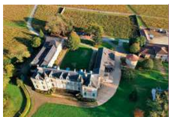
CHÂTEAU DU COING DE SAINT FIACRE