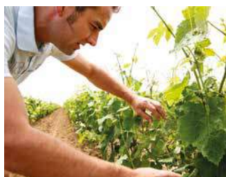
LEBRIN VINS LIBRES

Les vins sont travaillés de manière raisonnée et respectueuse. 15 cépages différents pour un parcours de dégustation unique aux assemblages innovants. Animations au domaine.