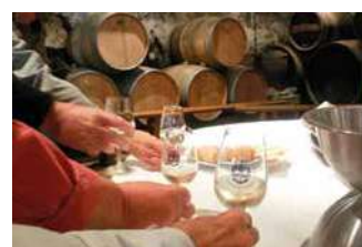
CHÂTEAU DE LA GALISSONNIÈRE