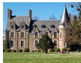
CHÂTEAU DE BRIACÉ

Le Château de Briacé, l'un des plus anciens domaines viticoles du vignoble. L'exploitation viticole est intégrée au sein d'un lycée professionnel agricole.