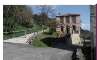
LE SÉCHOIR DU LIVEAU