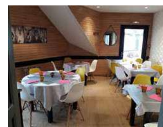
CLAIR DE LIE HÔTEL-RESTAURANT

Pour un déjeuner rapide, une pause gourmande, une réunion familiale, cuisine simple et efficace d'inspiration traditionnelle.