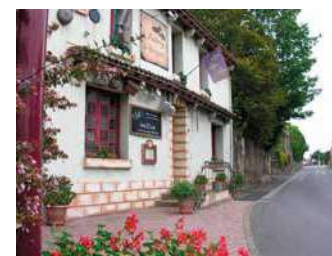
AUBERGE DES BRIGANDS

Ouvert 7j/7 en formule bar. Formule restaurant le midi du lundi au vendredi. Le soir et week-end, sur réservation.