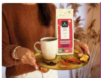
LA ROUTE DES COMPTOIRS

Importateur, transformateur, conditionneur de thés & infusions certifiés BIO et équitables. Boutique.