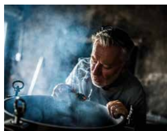
DOMAINE DE L'ÉCU

Bio depuis 40 ans, le domaine prend soin de son terroir et de ses vignes avec une culture bio-dynamique. Vinification en amphores. Animations au domaine.