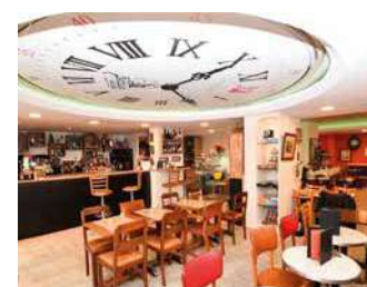
LES PENDULES À L'HEURE

Bistrot Brasserie Brocante, lieu chaleureux dans le cœur de Clisson. À chacun son heure pour prendre un verre, déjeuner, chiner, travailler ou faire une pause goûter. Plats à emporter.