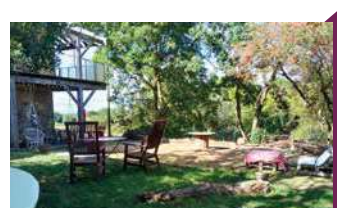
AUX 4 CHATS,