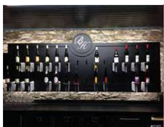
CHÂTEAU DU BOIS HUAUT

Le Château du Bois-Huaut, propriété viticole historique, vendange tout à la main ses 14 cépages différents. Animations au domaine. La Cave est dédiée à la vente directe et à la dégustation. Cours d'œnologie réservable en ligne tous les week-ends.