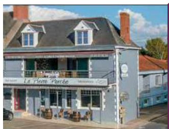
LA PIERRE PERCÉE

Le restaurant propose une gastronomie composée des essentiels des bords de Loire et du Vignoble. Plats à emporter.