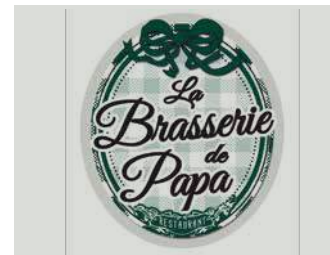
LA BRASSERIE DE PAPA

Lieu convivial et authentique près du Château avec une cuisine de terroir.