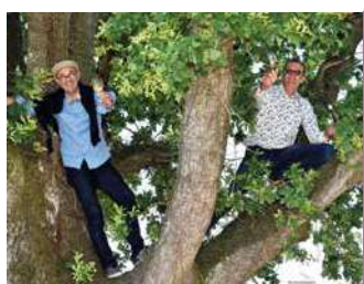
DOMAINE POIRON DABIN

Viticulteurs depuis 1858, la famille Poiron-Dabin a toujours aimé surprendre avec ses nombreux cépages et des vins d'excellence. Animation au domaine.