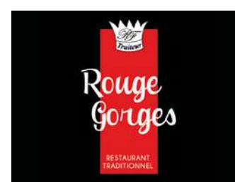
LE ROUGE GORGES

En parallèle de son activité traiteur Fabrice Roy a ouvert un restaurant. Une cuisine traditionnelle, à base de produits frais du marché.